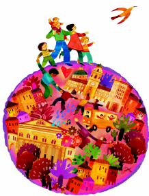
Agenzia per la Famiglia